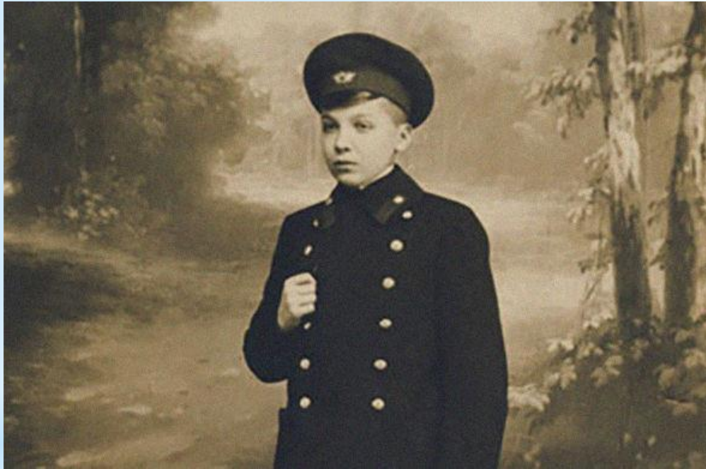
Образец школьной формы, утвержденной Николаем I

Первое свидетельство появления школьной униформы датируется 1834 годом . Тогда Николай I издал указ, утвердивший отдельный вид гражданских мундиров . К ним относились гимназические и студенческие мундиры.