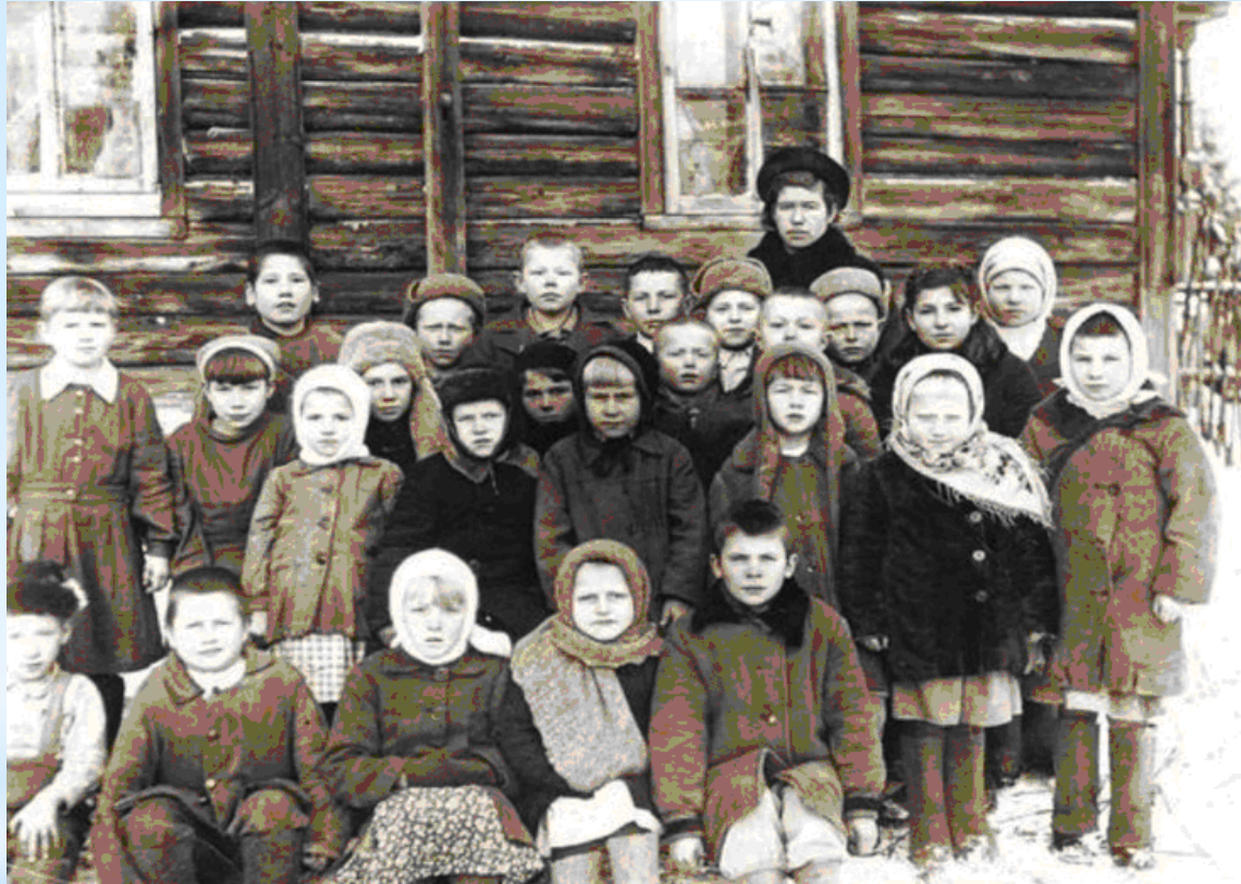
Ученики после революции 1917 года

После революции 1917 года школьная форма на время исчезла.