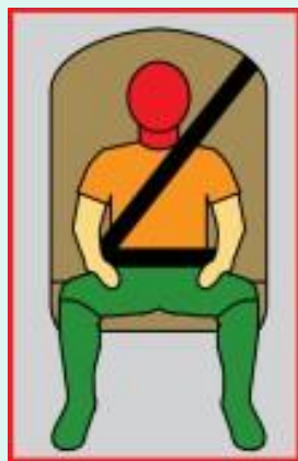
Без Устройства ФЭСТ