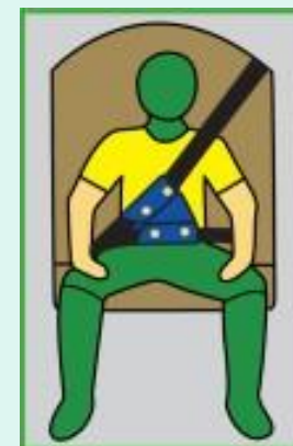
С Устройством ФЭСТ в комплекте с Лямкой ФЭСТ