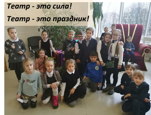
Театр - это сила! Театр - это праздник!

Позади первый учебный год, который был самый волнительный, где были новые чувства, обязанности, знания и, конечно же, друзья. А впереди нас ждет много веселья и интересных уроков.