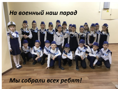
На военный наш парад