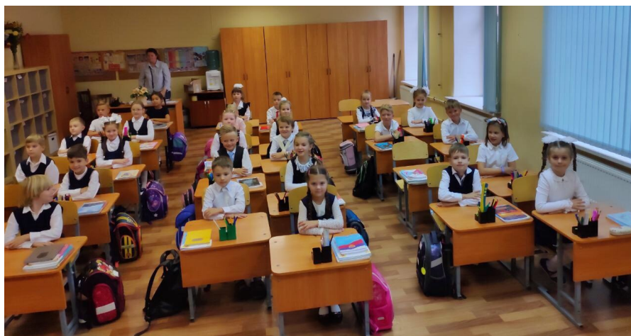
Может у нас и немного отличников, но зато мы воспитанный класс.