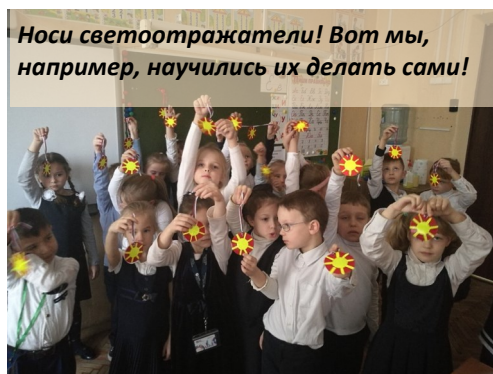
Носи светоотражатели! Вот мы, например, научились их делать сами!