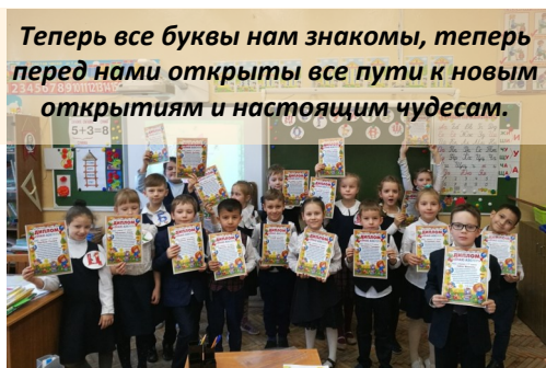
Теперь все буквы нам знакомы, теперь перед нами открыты все пути к новым открытиям и настоящим чудесам.