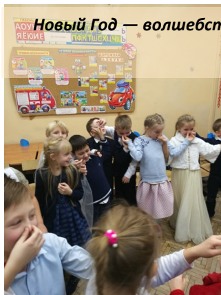
Новый Год — волшебство, в этот праздник всё-всё самое искреннее сбывается!