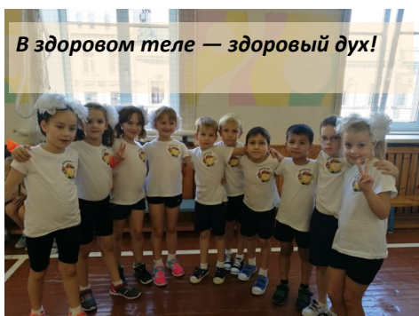
В здоровом теле — здоровый дух!