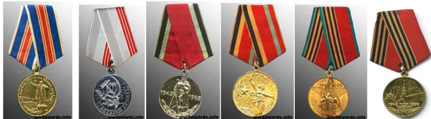
В ПАМЯТЬ 250 ЛЕТИЯ ЛЕНИНГРАДА ВЕТЕРАН ТРУДА 20 ЛЕТ ПОБЕДЫ В ВОВ 30 ЛЕТ ПОБЕДЫ В ВОВ 40 ЛЕТ ПОБЕДЫ В ВОВ 50 ЛЕТ ПОБЕДЫ В ВОВ