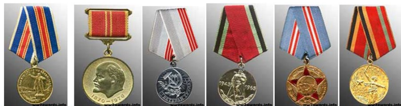
В ПАМЯТЬ 250 ЛЕТИЯ ЛЕНИНГРАДА ЗА ДОБРОСОСВЕТНЫЙ ТРУД ВЕТЕРАН ТРУДА 20 ЛЕТ ПОБЕДЫ В ВОВ 50 ЛЕТ ВООРУЖЕННЫМИ СИЛАМИ 30 ЛЕТ ПОБЕДЫ В ВОВ