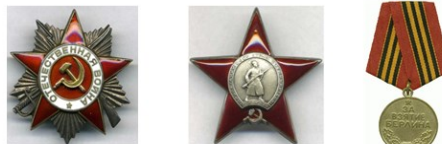
ОРДЕН ОТЕЧЕСТВЕННОЙ ВОЙНЫ II СТЕПЕНИ ОРДЕН КРАСНОЙ ЗВЕЗДЫ МЕДАЛЬ ЗА ВЗЯТИЕ БЕРЛИНА