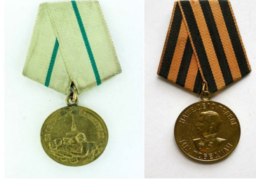
МЕДАЛЬ ЗА ОБОРОНУ ЛЕНИНГРАДА МЕДАЛЬ ЗА ПОБЕДУ НАД ГЕРМАНИЕЙ В ВОВ